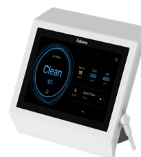
Moniteur Sur Pieds

Possibilité de montage sur des surfaces murales