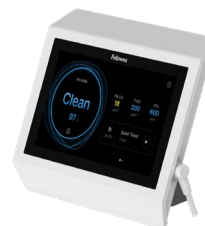
Possibilité de montage sur des surfaces murales